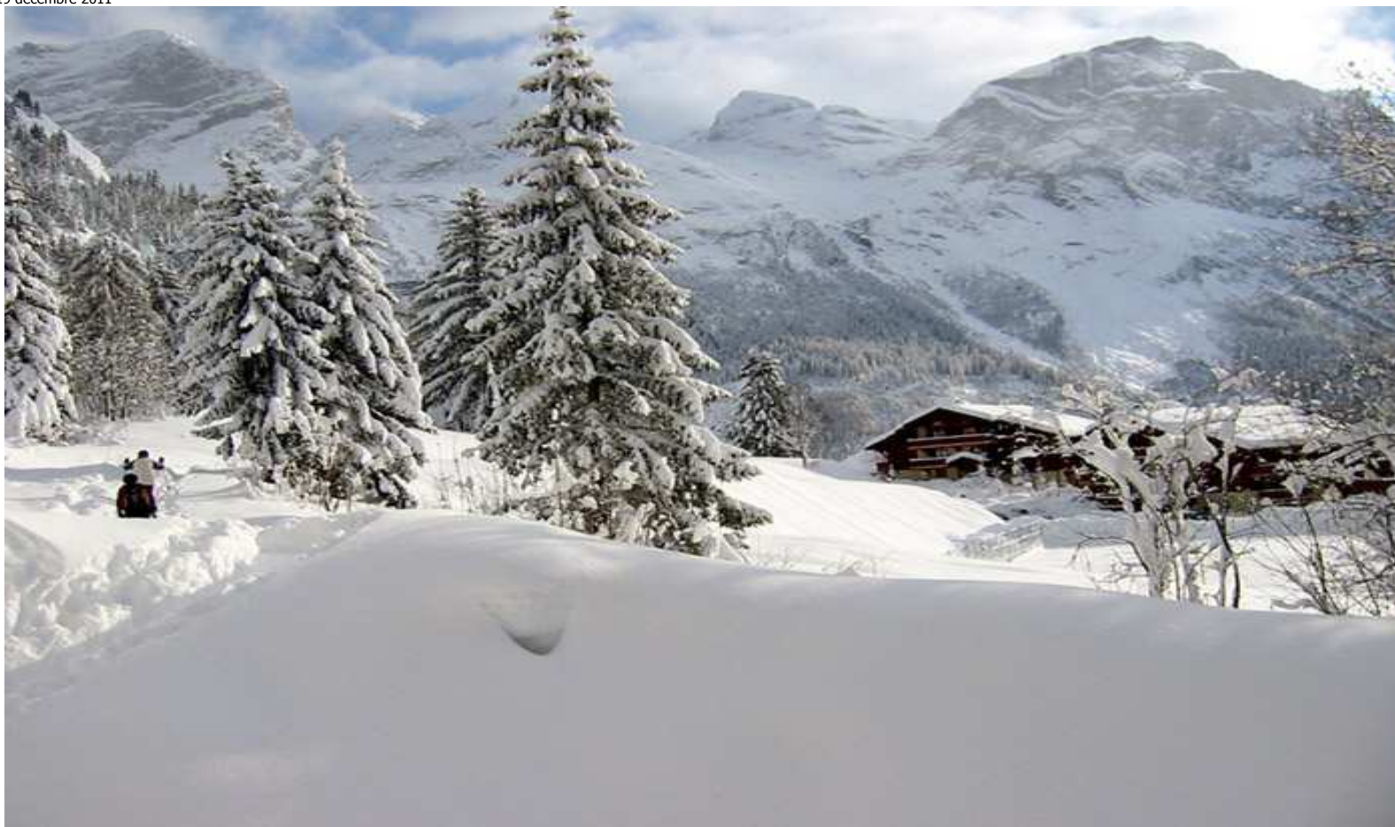
Pralognan La Vanoise