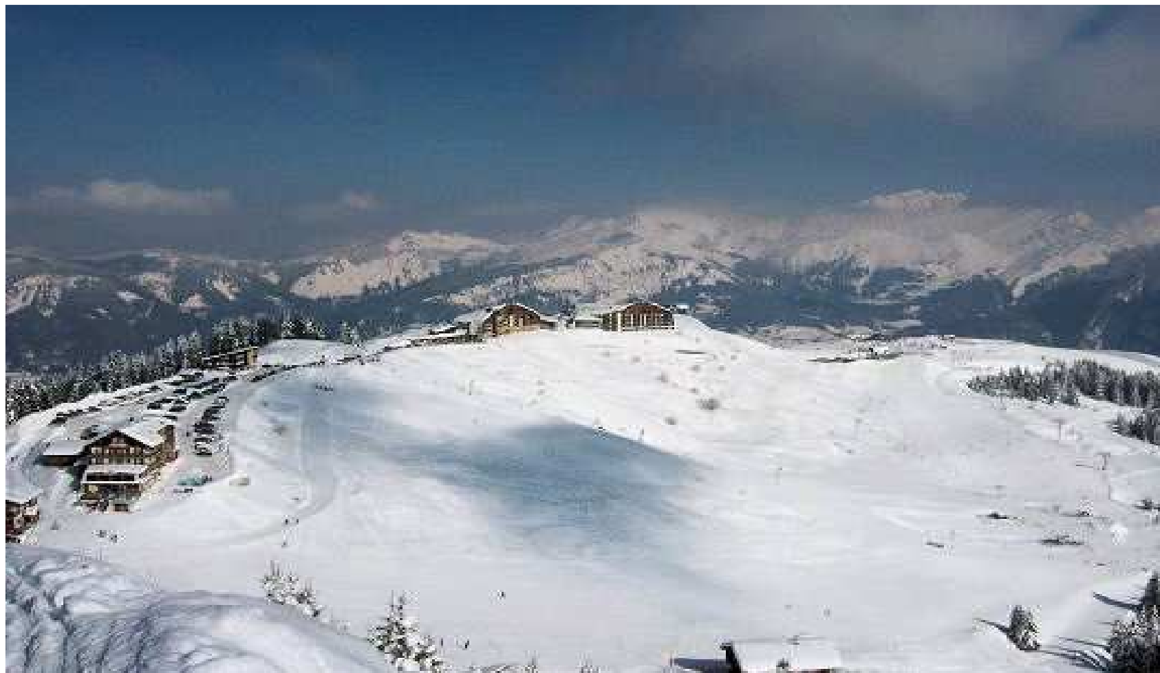
Samoëns 1600, Domaine du Grand Massif, Haute-Savoie.